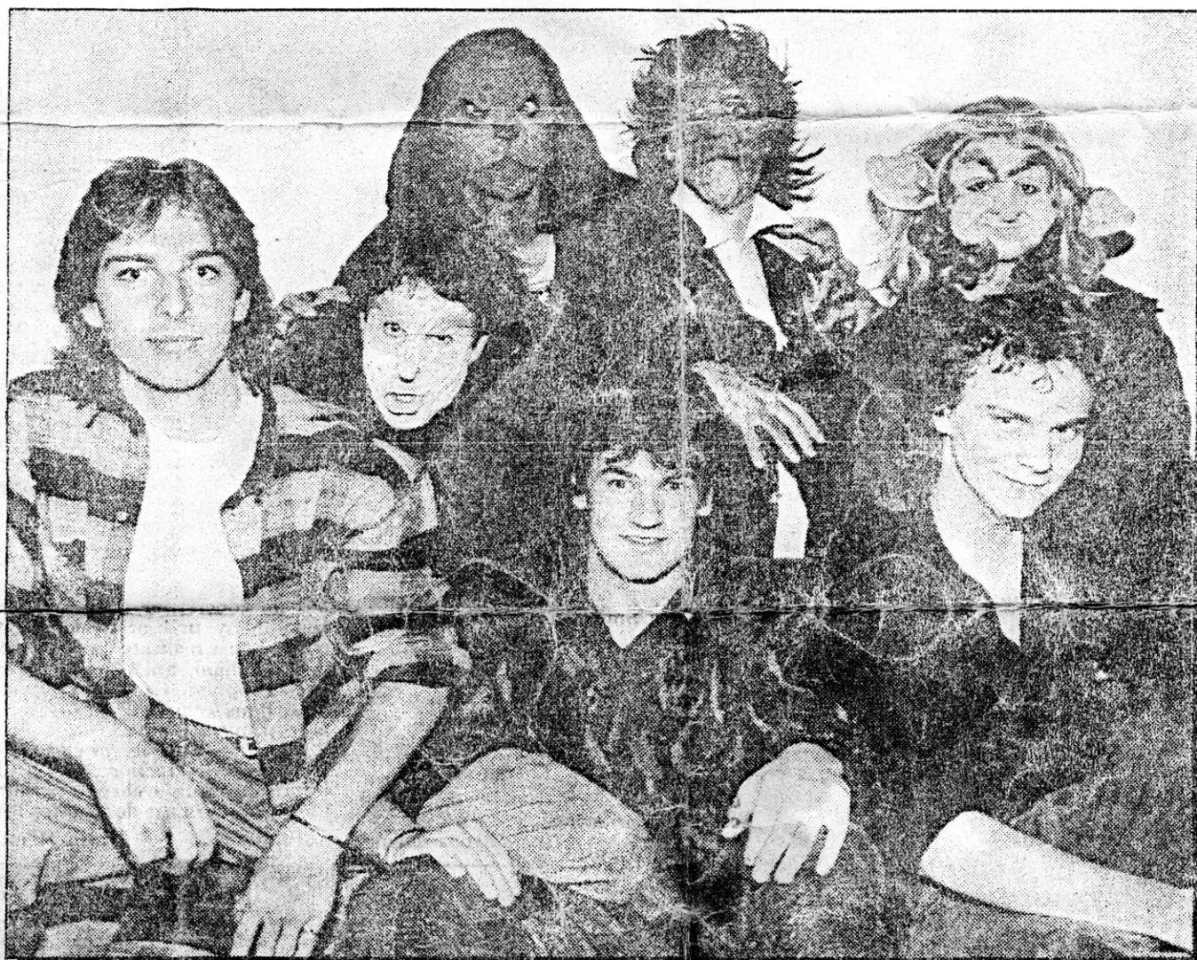
□ NOM DE CODE : LES « WIZARDS »